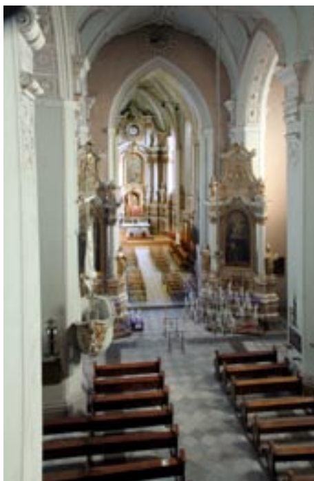
Wnętrze kościoła Franciszkanów, w oddali prezbiterium

Kościół w Kaliszu był pierwotnie bazyliką. W XIV wieku został przebudowany na halowy i dlatego trudno było zachować początkową koncepcję architektoniczną. Budowa samego kościoła od-