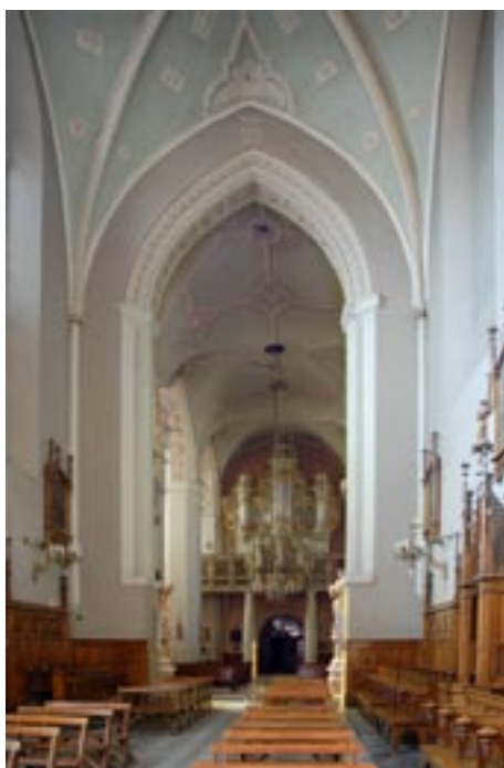
Widok od strony prezbiterium

bywała się najprawdopodobniej w kilku etapach. Początkowo musiała to być budowla drewniana, z czasem dopiero zastąpiona murowaną świątynią, gotową w całości w 1283 roku.