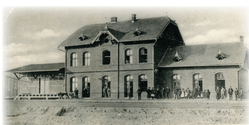
Gruss aus Pleschen 4 Stadtbahnhof.

Skład paliwa znajdował się po drugiej stronie torów, gdzie w olej i ropę zaopatrywała się część taboru.