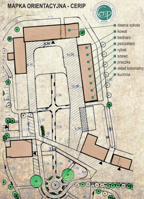
MAPKA ORIENTACYJNA - CERIP

w garnkach miedzianych smażymy, i we wrześniu zapraszamy zawsze trzecia to niedziela - bez Ciebie nie zaczynamy!